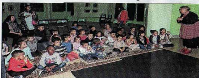
Le parterre d'enfants, un excellent baromètre pour l'artiste.

Les petits de l'Accueil de loisirs des Prés Saint-Jean sont tombés sous le charme de Mademoiselle Julie, une drôle de princesse qui s'est produite sur scène, mardi après-midi, à la Maison verte.